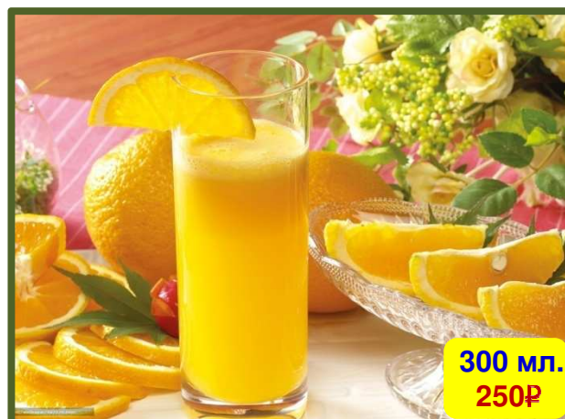
Fresh Orange Juice 新鲜的橙汁