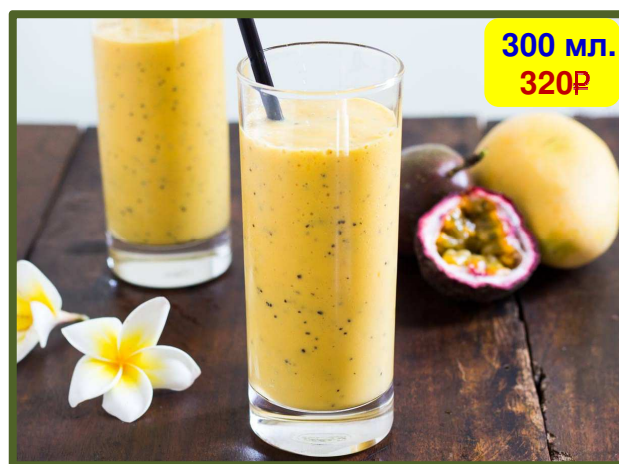
Mango Passion Fruit Smoothie 芒果 - 西番莲果冰沙