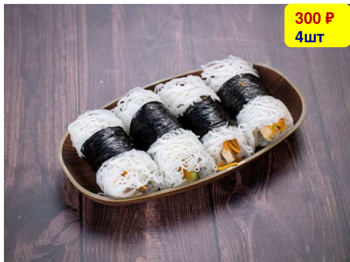
Рис ролл Bánh hỏi

Состав: Рисовая лапша, авокадо, огурцы, вегетарианская колбаса, морковь, листья нори