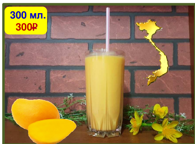
Mango Smoothie 芒果冰沙