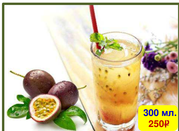
Fresh Passion Fruit Juice 新鲜的百香果汁